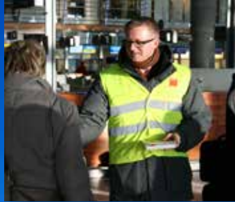
Streik med sympati til arbeidsgiver