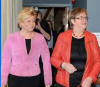
Finansminister Siv Jensen på besøk hos YS